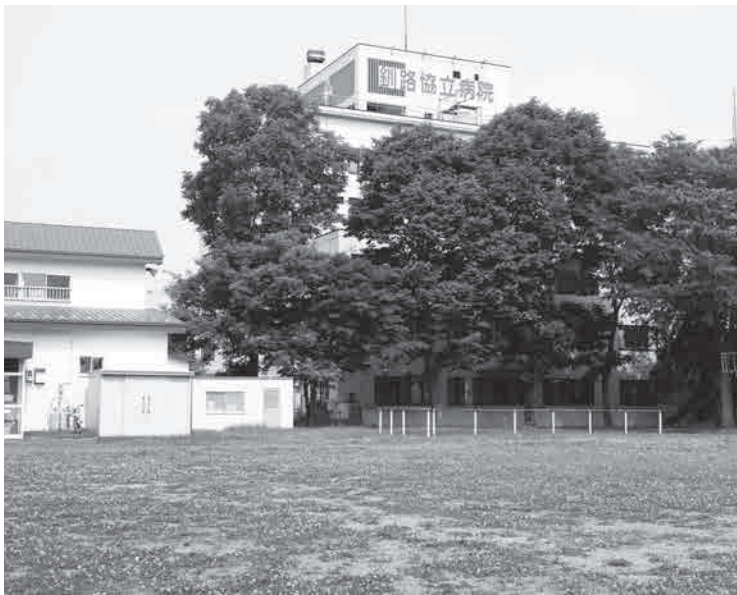
協立病院と隣接する治水公園

く、市有地であっても市の一存では決められないとのことでは決められぬか、昨年末に釧路市から「地域医療の確保のために」特例として対応するというお話をいただいたという経過です。7月5日に開催された住民説明会での市の説明では特例措置の理由として、道東勤医協は社会医療法人の認定を受けていて公的病院と同等であり、公的病院の移転新築のために公園の土地を使用して医療・介護体